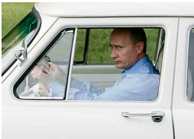
При Владимире Путине российская экономика пошла в гору.

Рекордный показатель прямых иностранных инвестиций – это, возможно, лучший индикатор восприятия российского инвестиционного климата представителями бизнеса. Но не все так безоблачно.