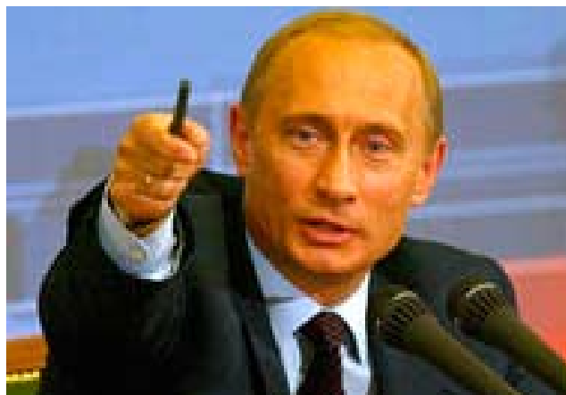
Путин: Герой новостей.

А что же телезрители узнали о главном конкуренте «Единой России» — Коммунистической партии Российской Федерации (КПРФ)? За то же время она была упомянута в эфире этого же канала всего 15 раз — в сухом, сугубо информационном стиле, вроде: «Лидер КПРФ Геннадий Зюганов уехал в Омск».