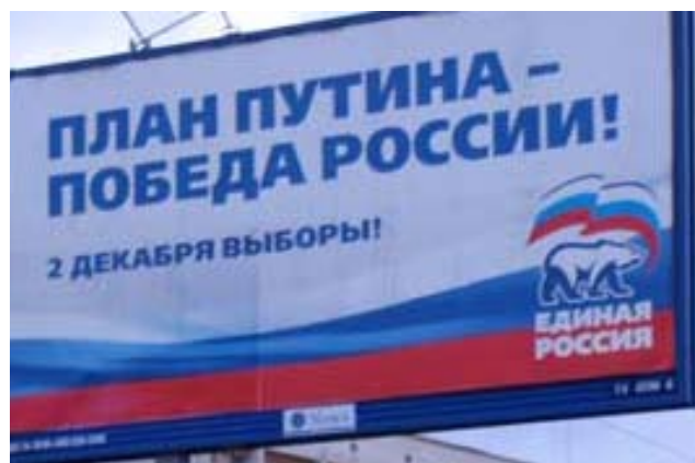
Плакат «Единой России» рекламирует «План Путина — Победа России».

В пределах кольцевой дороги Москвы политическая элита ориентируется на партию власти, но когда аналитический