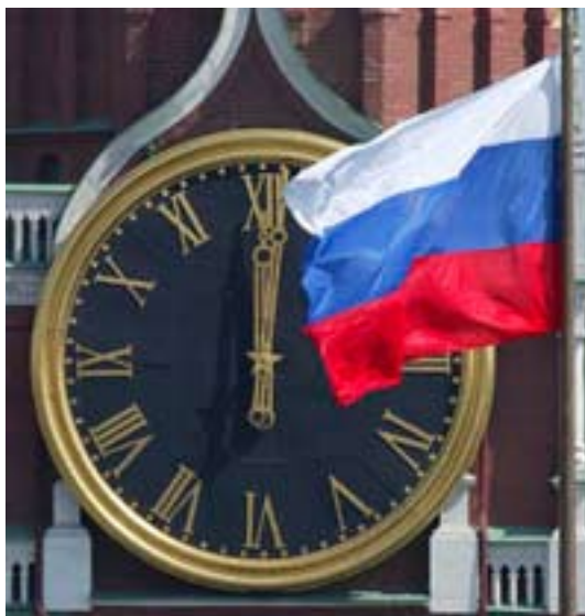
Не время для среднего класса.

В этих странах авторитарные методы использовались для перехода от аграрного общества к индустриальному — с этой задачей легко справился Иосиф Виссарионович Сталин еще 60–70 лет назад. А в Европе такой переход был осуществлен еще в 18–19 столетиях, тоже, кстати, не самым гуманным образом.