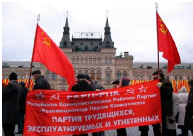
Некоторые россияне тоскуют о былом.